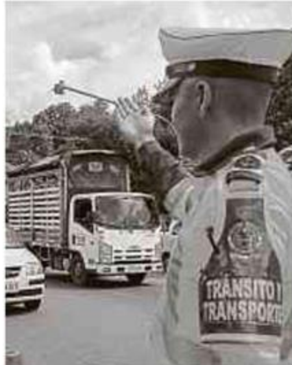
Aumentan controles en las vías.

En el puente de Reyes no habrá limitaciones entre los municipios. Pág. 7